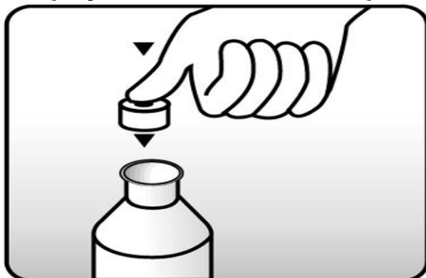
Fig. 1: coloque a tampa com orifício (batoque) no frasco.